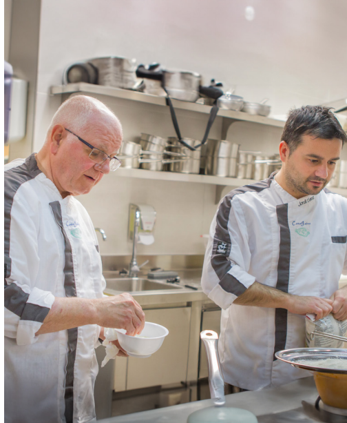
JAIME SANZE HIJOS

Av. del Papa Luna, 5 · 12598 Peñíscola (Castellón) · 964 480030 casajaimel967@gmail.com · www.xn-casajaimepeiscola-pxb.com/